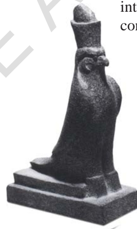
HORUS, “EL HALCÓN”, FUE UNA DEIDAD IMPORTANTE EN LA MITOLOGÍA DINÁSTICA (3500 A. DE C.)