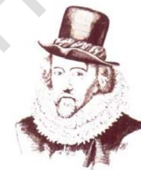
Sir Francis Bacon

Como resultado lamentable, la mayoría de los seres humanos ocupan posiciones ordinarias en la vida, sin ningún intento de lograr lo que de-